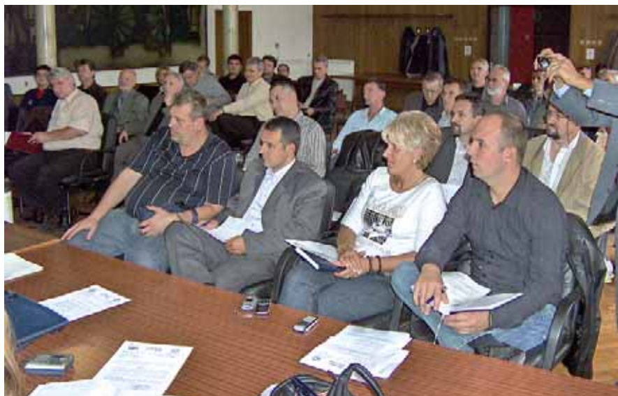
Главни одбор: Пуно поверење Извршном одбору