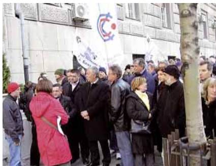
Пројект њ предсјавника КСС-а

То је наравно неправда, али и није први пут да се сусрећемо са оваквим односом према ПТТ-у. А како од кукања нема вајде, већ покушавамо да у надлежном министарству обезбедимо састанак и покушамо да аргументима изборимо барем нешто пре најављеног замрзавања. Аргументе, наравно, имамо. Зараде делимо са нашег рачуна без дотација државе, плате нису исте у свим јавним преду-