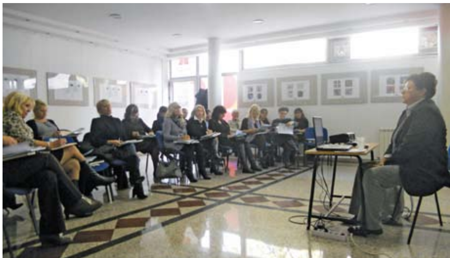
Детаљ са предавања: Наше колеџице у првим редовима

У децембру 2009. године донет је Закон о равноправности полова који одређује да су сви дужни да поштују равноправно учешће жена и мушкараца у свим областима јавног и приватног сектора,