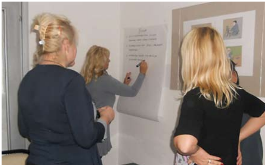
Практичан део семинара је изведен кроз радионицу

У складу са тим, Синдикат ПТТ Србије је отпочео активности на формирању женске синдикалне мреже. Циљ нам је да се што више наших колегиница активно укључи у рад, да сагледамо проблеме и предложимо решења која ће утицати да положај жена у Пошти буде што је могуће бољи. За почетак се кренуло са едукацијом и упознавањем са правима и законском регулативом из области родне равноправности, а у овом првом кораку ради се на едукацији активиста нашег синдиката које ће даље ширити мрежу и преносити стечених знања.