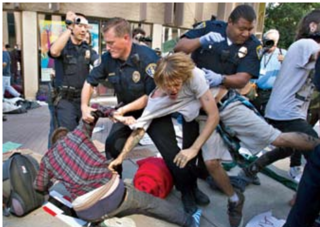
Покушај полиције да ослободи Вол стрит

на правне тимове који траже начине да их ослободе уговора о здравственом осигурању