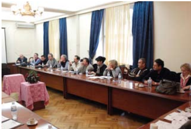
Пред новим изазовом: Регионална Скупштина Регије I

Као и увек расправљало се и о зарадама. Истакнуто је да је минимум који радници Поште очекују очување реалних зарада и исплата зараде из добити. Према садашњим подацима којима располажемо, очекујемо да ће следећа година бити на нивоу садашње, али су предвиђања за 2013. веома лоша. Ако се до тада на глобалном економском плану не десе значајне позитивне промене, имаћемо брдо проблема. Поред зарада, овога пута акценат је стављен и на очување радних места у условима економске кризе и најаве отпуштања великог броја радника свуда у свету и то посебно из јавних служби. За тај сценарио који је већ задесио наше колеге у окружењу,