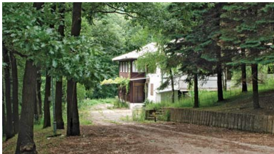
Поштански дом на Космају: Насијавак радова на пролеће