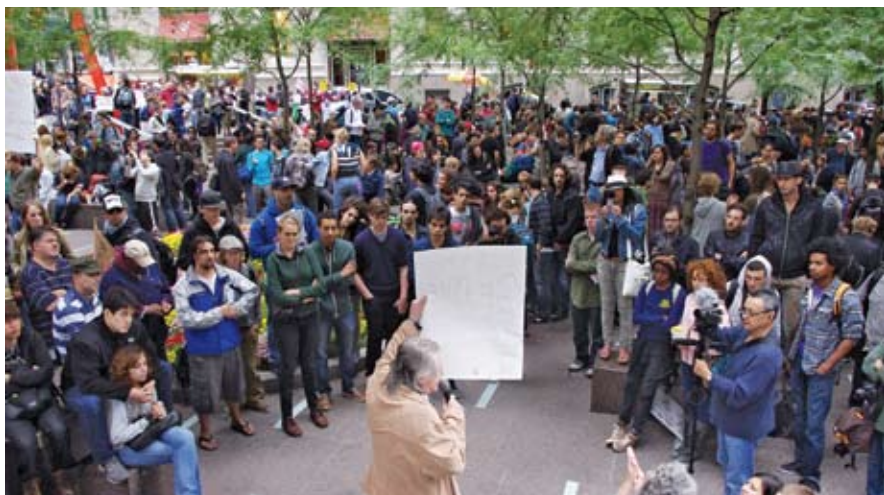
Овако је почело: Окупирање незадовољних испред свейског центара моћи

Задивљујуће је да су ови „нови клинци“, без икаквих претходних стратегија, програма, лидера, симбола, кренули у правом смеру, на централу светске моћи – Волстрит. Они нису кренули на Белу кућу и Конгрес, или Ленгли и Пентагон, већ на стварни центар светске моћи. Паролу „Окупирај Волстрит“ нису добили од инструктора на неком транзиционом курсу. Протести гневне омладине захтевају транзицију, али у обрнутом смеру, од грамзивога, подивљалог неолибералног капитализма, који је направио хаос у свету, ка још недефинисаном, социјално праведнијем систему. Волстрит је срце корпорацијског система, тачка где се укрштају токови анонимног капитала, његових злочиначких активности, банкарских и берзанских спекулација. Али, корпорацијски систем је створила држава. Стварајући корпорацију, држава је с њом поделила моћ и оставила немоћним своје грађане. Оставила их је на милост и