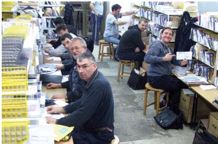
Поштари поручују: Стање на достави поштије неиздрживо

Поштари дају свој контрапредлог а то је да се ангажују нови радници. Сигурни смо да у Предузећу има најмање 400 радника који могу да се ангажују као достављачи и настали проблем ће лако бити решен. Желимо да се престане са лицемерјем и да се поштари прозивају због лошег квалитета услуга, а да се