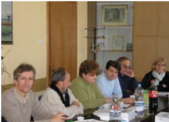
Регија II: Мора се ценити фактичко стање и уважавати интерес Поште