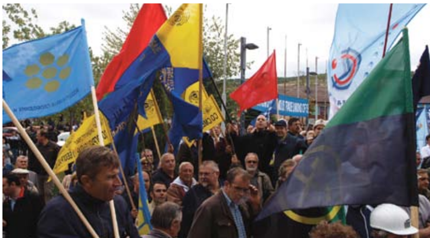
Демонстрација са синдикалног покрета: Тражимо минимум социјалне сигурности

Синдикати сматрају неприхватљивим садржај предложених измена и