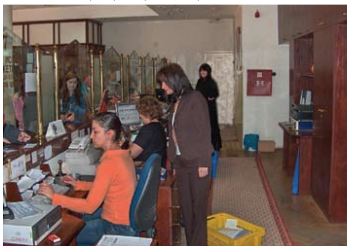
Напог на контролор: Питамо се – ко је следећи?

У разговорима са њиховим синдикалцима сазнали смо да је овакав начин рада изазвао много проблема. На наше питање како тај читав пројекат функционише у стварном животу одговор је био – никако. Порука коју смо понели је била више него јасна: „Немојте да дозволите да вам наметну модел који доноси само проблеме!“