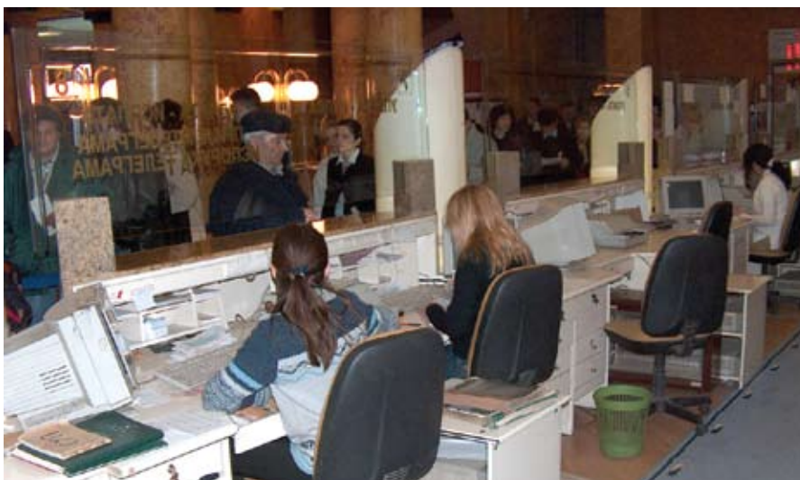
Честіа дилема: Који од уіуіуісїава и ї правилника їрмениїи

Знамо да се пређени пут рачуна на петосатној достави. Потребно је омогућити да поштоноша може да испоштује радно време и са рејона се врати сходно путном листу (осим у изузетном случајевима) неколико пута месечно – када су поделе новчаних дознака или велике количи-