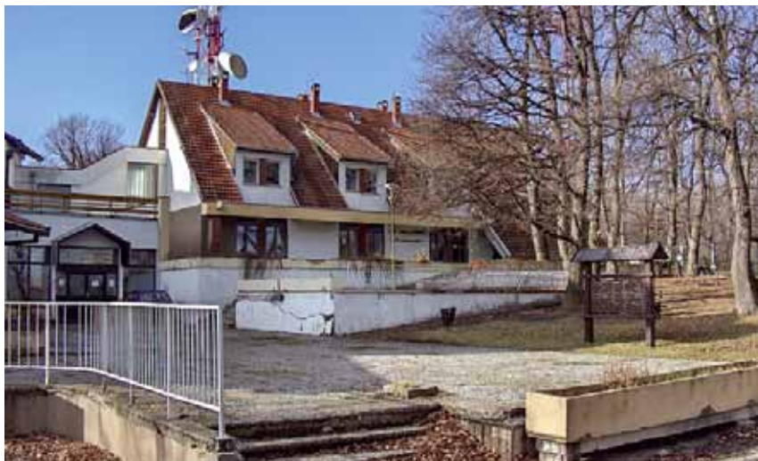
Проблем са најушћеним објектима на Космају, Дивчибарама и Фрушкој Гори решив, али кроз сирајешко јарћнерство

Тужна је прича како смо под крилатицом „нема више самоуправљања“ изгубили радничка одмаралишта. Период од стварања Јавног предузећа ПТТ саобраћаја „Србија“, када се говори о боравку запослених у одмаралиштима, можемо поделити на време „пре Јакшића“ и „после Јакшића“.