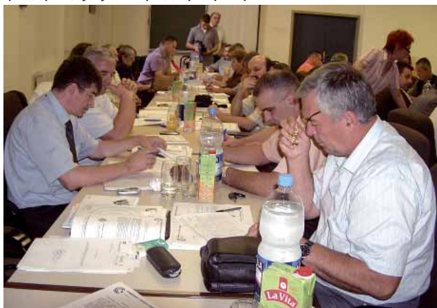
Добро припремљена Скупштина резултирала одлукама ојстанка: Чланови Скупштине