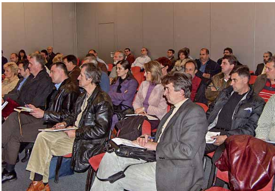
Чланови Главне одборе: По ишћању зарада никада нећемо бити задовољни

сарадњу. Они су одобрено организовани, поседују и образован кадар и јаку организацију, а имају, за разлику од нас, довољно новца да могу да спроведу своје акције. Ми управо стварамо тимове људи који ће „притискати“ владу и послодавце нудећи конкретна решења, што до сада