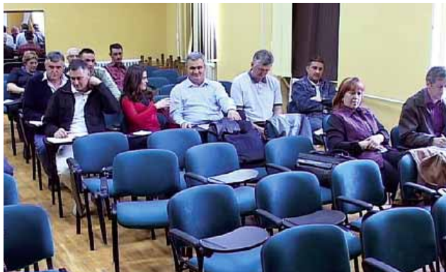
Семинар за синдикалне представнике у Кикинди

На страни послодавца (ма како се звао) је политичка ноћ, новац, влашћења и хиљаду тачака на крају. На страни синдиката је снага која се може одржати само уз помоћ свих чланова, спремности да се ставови бране и си-