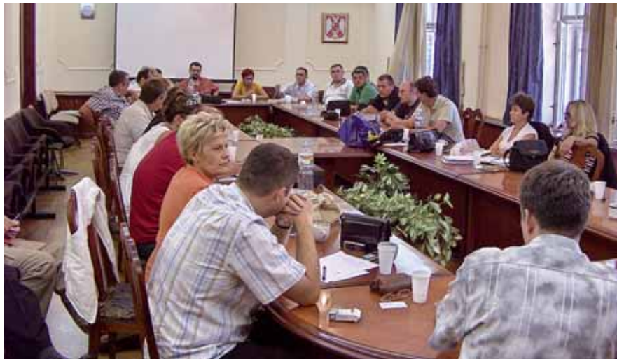
Једнодушан сѝав ѓреседника СО: Неојходно је даље јачање унутрашњих веза у Синдикалу ПТТ Србије

– Конфедерација слободних синдиката била је сјајна идеја, али се слабо шта реализовало и сада је отворено питање како ће бити организована КСС.