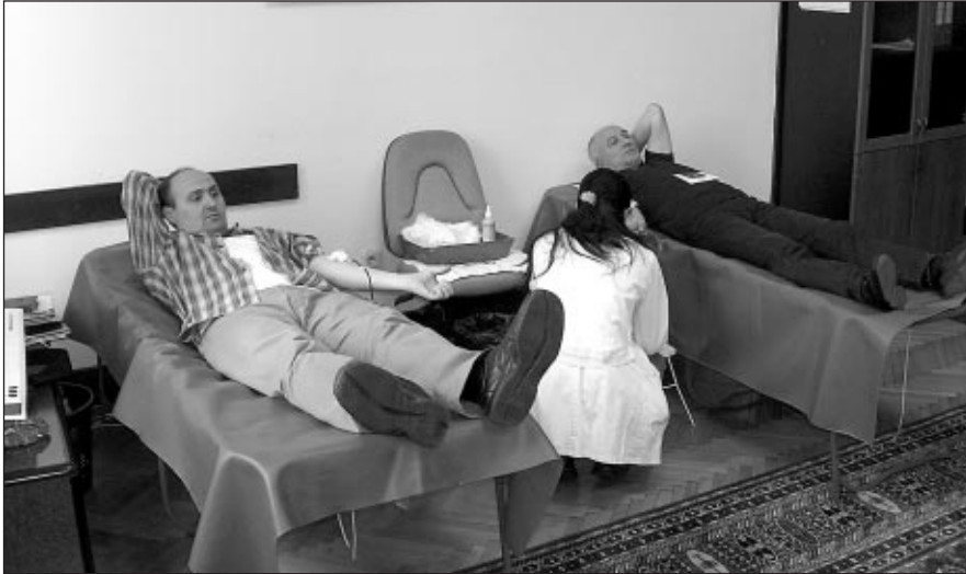
Акција добровољног давања крви у Дирекцији предузећа

Цивилна заштита је организовани одговор друштва на све облике угрожавања живота људи, материјалних добара и животне средине. Развојем и успешним деловањем цивилне заштите стварају се услови за смањење људских и материјалних губитака, за правовремену помоћ запосленима када им је она најпотребнија, као и за функционисање ПТТ система у случају