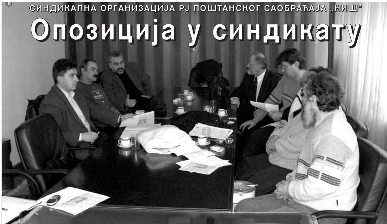
Седница Одбора синдикалне организације Ниш

Иницијативе и захтеви који су у последње време стизали из синдикалне организације РЈ поштанског саобраћаја "Ниш", као и ставови и излагања њиховог представника на седницама Главног одбора, били су повод да чланови Издавачког савета посете Ниш и присуствују седници Одбора ове синдикалне организације. Била је то и прилика да се лично упознамо са члановима СО, њиховим радом а пре свега њиховим ставовима у вези са актуелном ситуацијом у Предузећу и Синдикату ПТТ Србије.