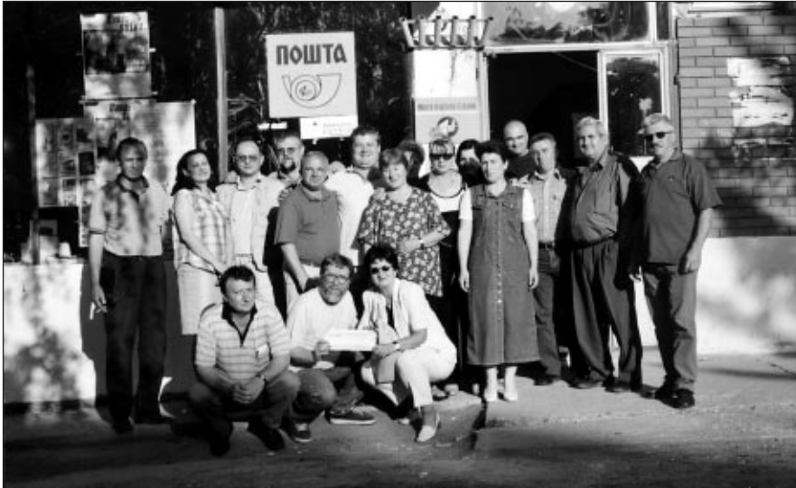
Управни одбора Фонда солидарности са колегама испред поште у Косовској Митровици

Сигурно је да тешка економска ситуација, која на нашим просторима траје већ доста дуго, има утицаја на велика потраживања и велики барој захтева који се свакога месеца упућују Фонду солидарности Синдиката ПТТ Србије. Да подсетимо, учлањењем у Синдикат ПТТ Србије постаје се и члан Фонда солидарности који функционише према сопственом правилнику и упутству за рад. Случајеви у којима се стиче право на коришћење средстава Фонда стриктно су и детаљно прописани поменути актима а поменућемо оне најчешће коришћене: боловање преко три месеца, смртни случај члана Фонда или члана породице, лекови и надокнаде трошкова лечења, итд. Правилником је такође предвиђено да члан Фонда свој захтев са потребном документацијом предаје својој синдикалној организацији а она га, након провере, прослеђује Управном одбору Фонда до 15-тог у месецу.