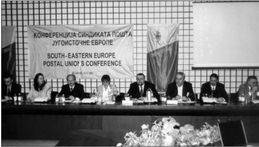
Радно председништво и гости Конференције

У Београду је, у организацији Синдиката ПТТ Србије, крајем прошле године одржана Конференција синдиката пошта Југоисточне Европе. Конференцији је присуствовало 17 делегација из 12 земаља, као и представници међународних организација рада. Циљ овог скупа је била међународна афирмација нашег Синдиката, упознавање са токовима на тржишту поштанских услуга у Европи и помоћ у процесима који нас очекују.