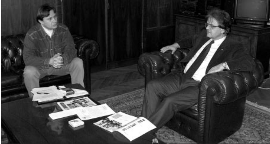
Разговор са председником Управног одбора Предузећа

постављамо чланове Управног одбора, као и генералног директора Телекома. Све то на изглед функционише, али проблеми настају када људи које ми поставимо забораве зашто су тамо и каква је њихова мисија, па почну да се понашају по својој слободној вољи и губе комуникацију са органом који их је ту именовао. Ми смо, покушавајући да решимо ове проблеме, увидели да не постоји ни један акт Предузећа који регулише ову материју и на основу кога би именована лица могла да сагледају своје обавезе. Зато је Управни одбор ПТТ-а донео одлуку која има улогу јавног акта и у којој се прописују обавезе чланова управних одбора и именованих лица од стране нашег Предузећа, а по основу учешћа у акцијском капиталу тих предузећа. Очекујемо ускоро и прве резултате ове наше одлуке и враћање позиције која нам по закону и обичајима акционарства припада.