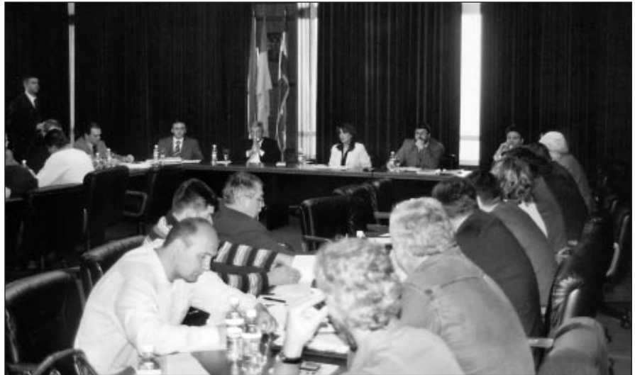
Округли сто пословодства и синдиката

У Предузећу није било довољно воље а ни храбрости да се крене са решавањем нагомиланих проблема, па се чини да пословодство једини