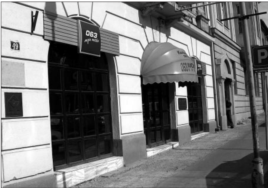
Кориснички сервис Мобтела у Косовској

Главни одбор Синдиката ПТТ Србије је на својој последњој седници разматрао и питење Мобтела у пакету са осталим предузећима у којима смо, бар формално, власници и акционари. Из расправе је проистекао захтев ГО да се из Управног одбора Мобтела повуку наши представници и замене новим људима, који ће много срчаније бранити интересе Поште