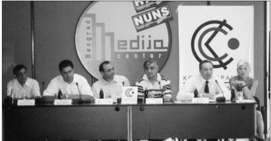
Са конференције за штампу Конфедерације слободних синдиката

Председник Синдиката ПТТ Србије наглашава и да са претходном Владом Србије није успостављен партнерски однос и да је чак било опструкције рада Конфедерације и у медијима и у ресорном министарству. С обзиром да је нови министар човек који је професионално